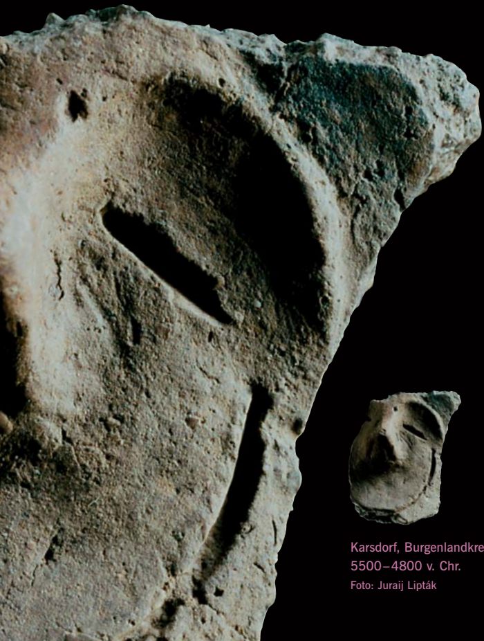
Karsdorf, Burgenlandkreis 5500–4800 v. Chr.