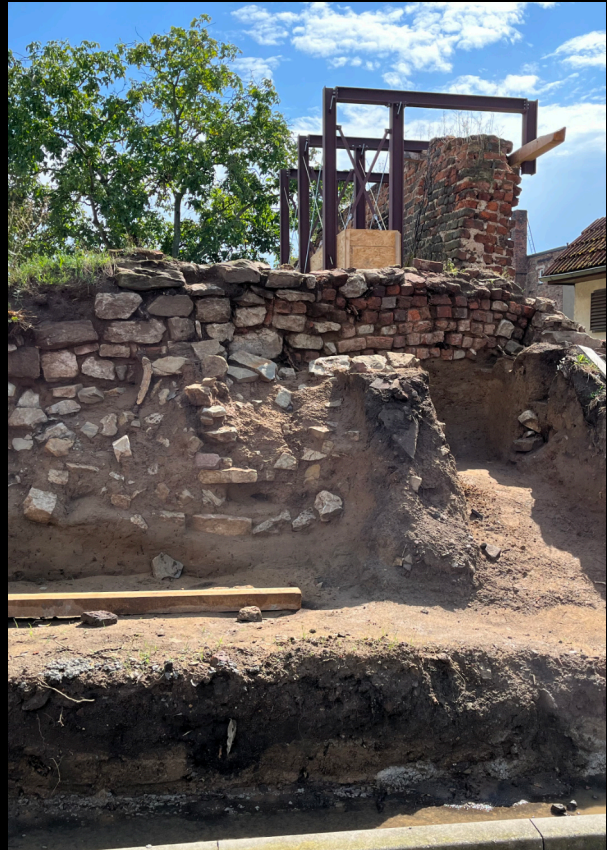
Die archäologischen Grabungen an der Stadtmauer Aken

Aken wird 1271 erstmals als Stadt bezeichnet und war zunächst mit einer hölzernen Palisade befestigt. Die im 13./14. Jh. aus Stein errichtete Stadtmauer ist zu großen Teilen erhalten. Reparaturen, Umnutzungen und Wallanschüttungen überformten das einstige Erscheinungsbild deutlich. Im Zuge der aktuellen Sanierungsmaßnahme an der südwestlichen Ecke der Stadtmauer gelang es, den ursprünglichen Verlauf der Stadtmauer des 13./14. Jhs. zu rekonstruieren. Im Gegensatz zum heutigen, diagonal abgeschragten Erscheinungsbild umgab anfangs eine rechteckig ausgeformte Anlage den Ort. Zudem fällt auf, dass die Gründungslage auf einer künstlichen Aufschüttung errichtet ist, die nach Norden und Osten abfällt. 14 C-Proben aus der Aufschüttung datieren ins 11./12. Jh.; ein direkter Bezug der Aufschüttung zur Errichtung der Stadtmauer kann somit ausgeschlossen werden. Aus schriftlichen Quellen ist bekannt, dass südlich von Burg »Gloworp«, heute Lorf, westlich der heutigen Altstadt eine »antiqua civitas«, also eine »alte Stadt« existierte, von der zu Beginn des 18. Jhs. noch Wälle und Gräben zeugten. Es ist davon auszugehen, dass die Gründung der hochmittelalterlichen Stadtmauer auf Aufschüttungen dieser Vorgängersiedlung von Aken erfolgt ist. Die »antiqua civitas« konnte somit erstmals in datierten Geländestrukturen nachgewiesen werden.