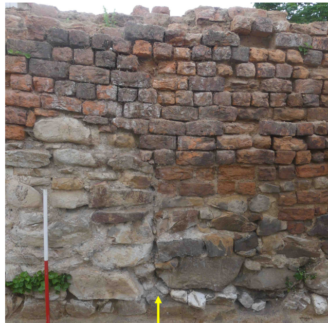
Abb. 3: Beispiel einer Baufuge (gelber Pfeil) in der westlichen Stadtmauer. Links davon handelt es sich um das Originalmauerwerk aus dem 14. Jh., rechts davon um eine Reparatur des 15./16. Jhs.