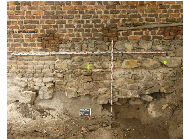
Abb. 5: Stadtseitige Ansicht der Stadtmauer im Süden. Die heute zugesetzten Schießscharten folgen dem Geländeanstieg nach Westen. Die Auffüllschichten unterhalb datieren ebenfalls ins 11. bis 12. Jh.