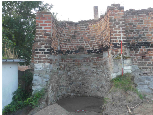
Abb. 4: Stadtseitige Ansicht des Halbschalenturmes im Bereich Bobbestraße aus dem 14. Jh. Holzkohle aus der Aufschüttung direkt unter dem Turm datiert ins 11. Jh. – also wesentlich älter. Blick nach Süden.