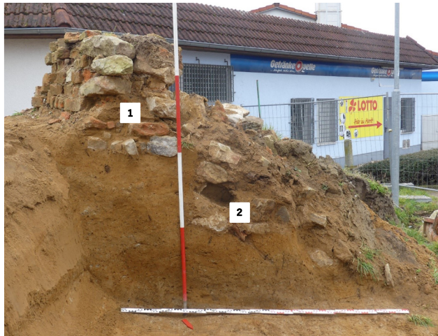
Abb. 2: Im Profil sind die Gründungen der jüngeren, materialsparenden und heute noch obertägig sichtbaren Reparatur (1) und der älteren, originalen Stadtmauer (2) klar voneinander zu trennen. Blick nach Süden.