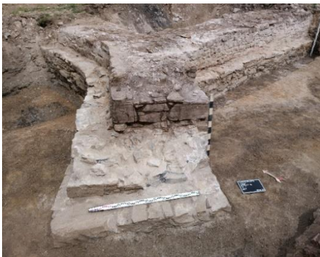
Abbildung 3: Strebepfeiler an der vermutlichen Katharinenkapelle.