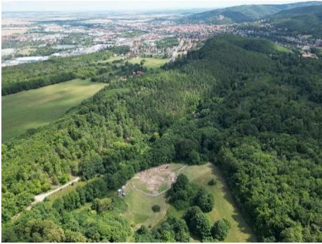
Abbildung 1: Blick über die Ausgrabungen am ehemaligen Kloster Himmelpforte in Richtung Wernigerode.