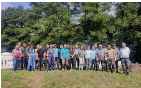
Abbildung 5: Die Grabungsmannschaft aus Archäologen und ehrenamtlichen Helfern.

Auf Wunsch schicken wir Ihnen die Bilder gern zu. Bitte wenden Sie sich an: oeffentlichkeitsarbeit@lda.stk.sachsen-anhalt.de