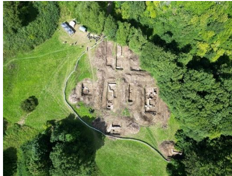
Abbildung 2: Überblicksaufnahme der Ausgrabungen am ehemaligen Kloster Himmelpforte.