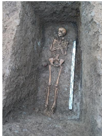
Abbildung 4: Die Bestattung der Gerrun von Königstein.