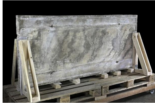
Abbildung 2: Die vom Steinkasten abgenommene, repräsentative Deckplatte, die von Wiener und Bochumer Spezialisten für die Herkunftsbestimmung antiken Marmors untersucht wurde.