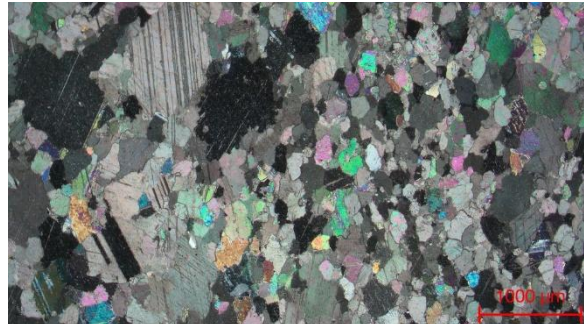
Abbildung 4: Mikroskopische Aufnahme der Marmorprobe aus dem grauen, deutlich feinkörnigeren Bereich der Grabplatte im Polarisationsmikroskop.

Auf Wunsch schicken wir Ihnen die Bilder gern zu. Bitte wenden Sie sich an: oeffentlichkeitsarbeit@lda.stk.sachsen-anhalt.de