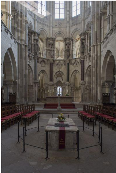
Abbildung 1: Der Sarkophag Ottos des Großen im Chorraum des Magdeburger Doms.