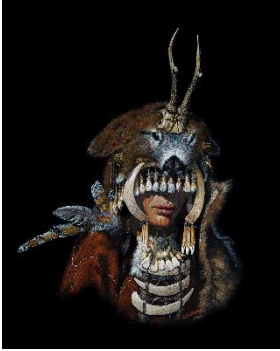
Abbildung 1: Künstlerische Rekonstruktion des Ornats der Schamanin von Bad Dürrenberg mit Federschmuck.