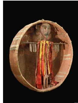
Abbildung 6: Historische Schamanentrommel mit ›Trommelgeist‹.  I A 1963.