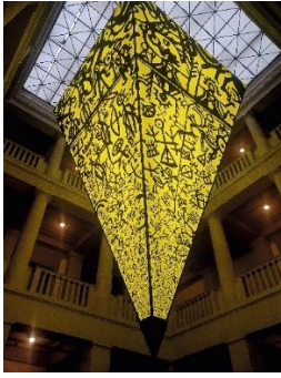
Abbildung 5: Die Zentralinstallation der Sonderausstellung.