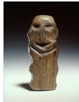
Abbildung 8: ›Männchen‹ von Willemstad (Niederlande), im Torf gefundene Menschenfigur aus Eichenholz, etwa 5400 vor Christus.