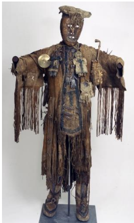
Abbildung 7: Robe eines Ewenken-Schamanen aus Rentierfell. © Ethnologische Sammlung der Georg-August- Universität Göttingen (Af 957a-s), Foto: Harry Haase.