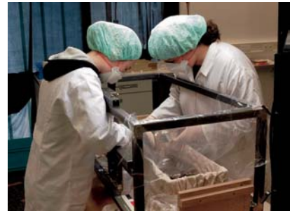
06.jpg Entnahme des Inhalts des bleiernen Sarges unter sterilen Bedingungen im Labor des LDA in Halle.