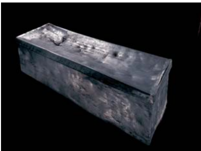
04.jpg Der Bleisarg mit Inschrift nach der Restaurierung im August 2009.