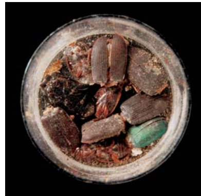
11.jpg Harpalus rufipes (Laufkäfer) aus dem Bleisarkophag. Dieser Insektenbefall ist höchst wahrscheinlich mit der letzten Umbettung von 1510 in Verbindung zu setzen