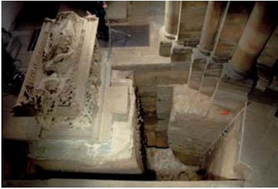
01.jpg Blick auf den vermeintlichen Kenotaph der Königin Editha im Chorumgang des Magdeburger Domes während der archäologischen Untersuchungen.