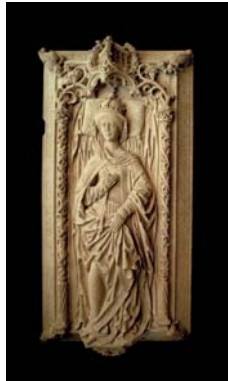
02.jpg Darstellung der Königin Editha auf dem Deckel des Steinkenotaphs von 1510.