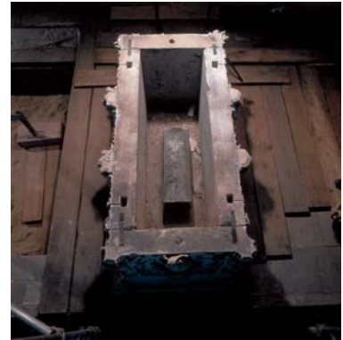
03.jpg Blick auf den Bleisarg im Kenotaph nach Abnahme der Deckelplatte.