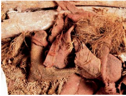
10.jpg Fragmente der verschiedenen, aus dem Bleisarg geborgenen Textilien, zumeist aus Seide.