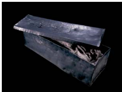
05.jpg In dem geöffneten Bleisarg ist bereits die Textilhülle der letzten Wiederbestattung zu erkennen.