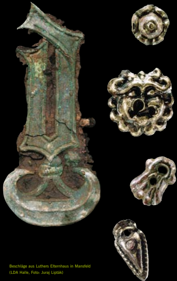
Beschläge aus Luthers Elternhaus in Mansfeld